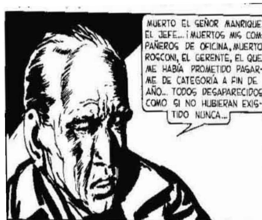
El Eternauta - H.G. Oesterheld, F. Solano López 1957

CITADO POR JUAN GELMAN, EN EL ARTICULO "DOCUMENTOS", DIARIO PAGINA 12, 15 DE NOVIEMBRE DE 1995.